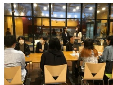
▲セミナー後の懇親会の様子